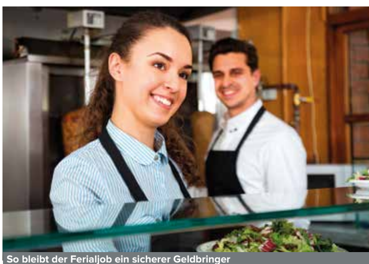
So bleibt der Ferialjob ein sicherer Geldbringer

Sommerzeit ist Ferienzeit! Viele Schüler und Studierende sammeln in den Ferien aber auch ihre ersten Erfahrungen in der Arbeitswelt. Das wiederum bringt ihnen die ersten selbstverdienten Euros. Für Eltern stellt sich nun die Frage: Wie viel darf der Nachwuchs mit dem Ferialjob eigentlich verdienen, ohne dass Familienbeihilfe und Kinderabsetzbetrag verloren gehen? CONSULTATIO News hat die Antworten parat. So können Sie Ihre Kids guten Gewissens an den Start gehen lassen!