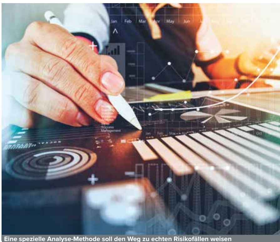
Eine spezielle Analyse-Methode soll den Weg zu echten Risikofällen weisen

Auch wenn es manchmal anders scheinen mag: Tatsächlich gilt die österreichische Finanzverwaltung als eine der modernsten Europas. Das beweist auch ein neues Verfahren, das rund um die Betriebsprüfungen zur Anwendung kommt. Es soll mit noch größerer Treffsicherheit Unternehmen aufspüren, die besonders prüfwürdig sind. Was hinter der innovativen Analysetechnik steckt und wen sie ins Visier nimmt, weiß CONSULTATIO News.